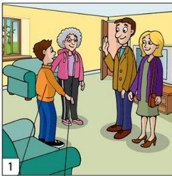
Grandma's busy day

You must write between 25-35 words. 20 points